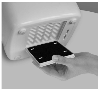
Рис. 9 Фильтр очистки воздуха Pre-filter

Воздух может содержать в себе различные примеси, которые могут при дыхании попадать в дыхательные пути человека или оседать в приборах. Фильтр очищает воздух от крупных фрагментов пыли, шерсти и защищает внутреннюю часть прибора и комплектующие от пыли и прочих примесей.